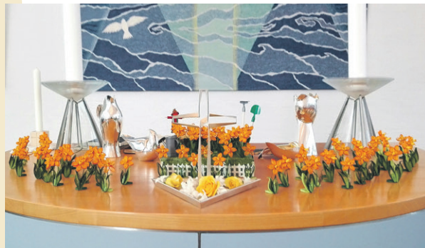
Alteret, som det var udsmykket ved en gudstjeneste påskedag i Klostermarkskirken. Mange fik en af de små påskelliljer med hjem.

For små 2000 år siden gik kvinderne ud til graven, hvor Jesus var blevet lagt. Inde i Jerusalem sad disciplene og tilhængerne. Deres livsindhold var forsvundet. Deres ven og frelser var død. Meningen var tabt, og opløsningen var begyndt. Men så lød kvindernes chokerede stemmer, da de kom løbende: ”Graven er tom!”. Og snart bredte opstandelsens håb sig ud til alle verdenshjørner. Håbet om at den opstandne også nu er på vej til os, for at skænke os vores egen opstandelse og hele verdensgenoprettelse.